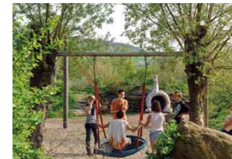
Natur-Erlebnis-Spielplatz Natur spielerisch erleben

Harmonische naturnahe Anlagen, in denen sich Natur und Mensch verbinden. Ohne schlechtes Gewissen. Kein Luxus auf Kosten anderer. Das ist das Prinzip naturnaher Gärten. Sie werden sich wohlfühlen. Eingebettet in die Natur.