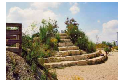
Natur-Erlebnis-Schulhof Bunte Vielfalt in der Pause