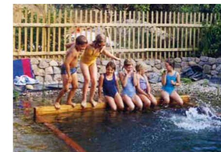
Natur-Erlebnis-Garten Die Elemente hautnah spüren